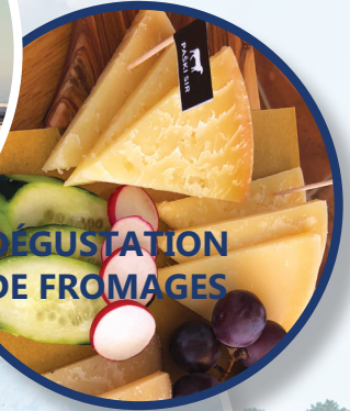
DÉGUSTATION DE FROMAGES