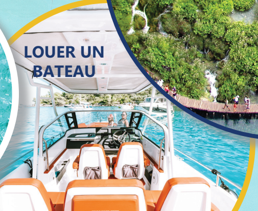
LOUER UN BATEAU