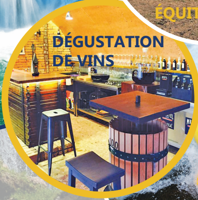
DÉGUSTATION DE VINS