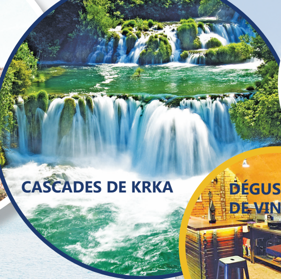
CASCADES DE KRKA