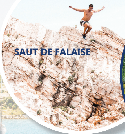
SAUT DE FALAISE